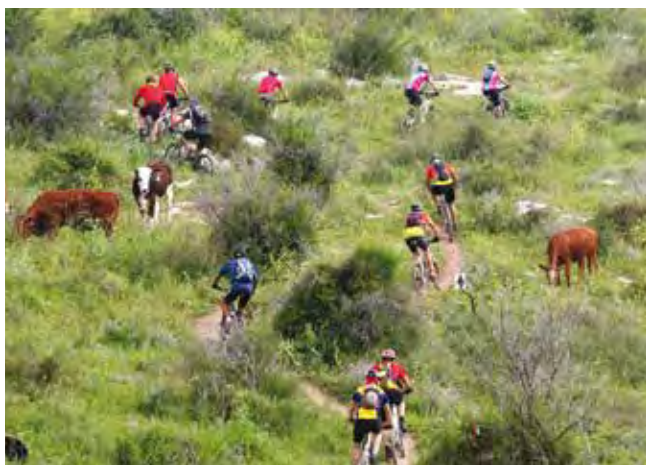
פעילות ספורטיבית בחיק הטבע.