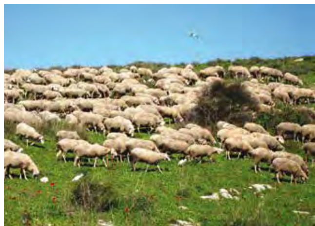
עדרים ברמות מנשה.

בין צורכי סביבה לפיתוח הן ההנחיות שהוציא הגוף המנהל את המרחב בשיתוף עם מחלקת הנדסה של המועצה לדופן יישוב ידידותי לסביבה. על פי הנחיות אלו לכל יישוב מיישובי המועצה יש הנחיות כיצד לשמור על הקשר בין דופן היישוב לסביבה שמחוצה לו מבחינת זיהום אור, מניעת כניסת מינים פולשים וסניטציה. פעולה נוספת שמקדמת המועצה במסגרת המחויבות לאיזון סביבתי היא הפרדת פסולת לזרמים (יבש ורטוב) ושימוש בקומפוסט לחקלאות המקומית.