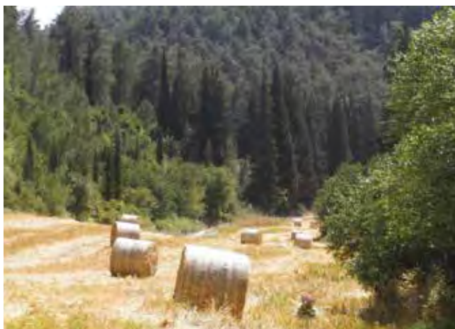
נחל השופט.