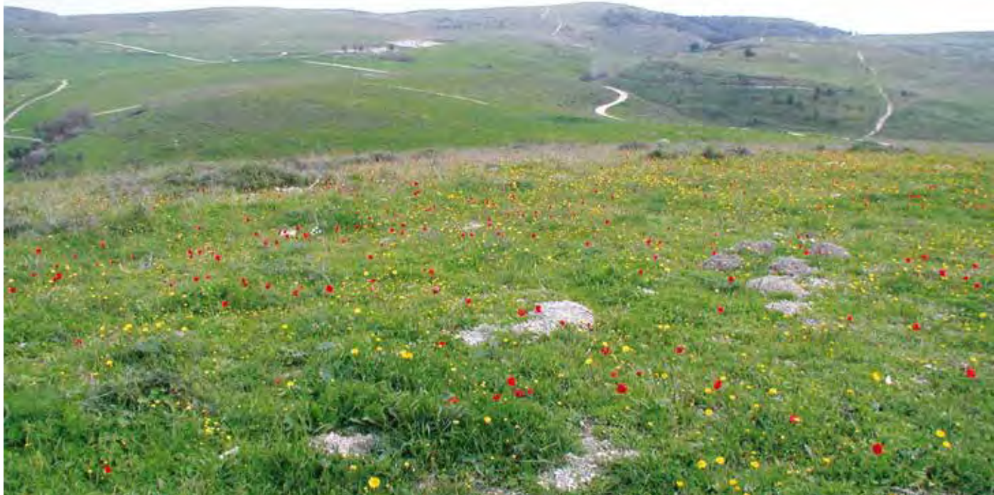
תמונת נוף אזור גלעד.

מילות מפתח: מרחב ביוספרי, מרחב כפרי, ניהול, מועצה אזורית מגידו